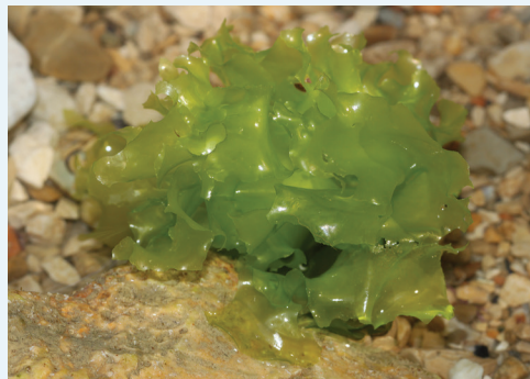
Ulve (Ulva lactuca)